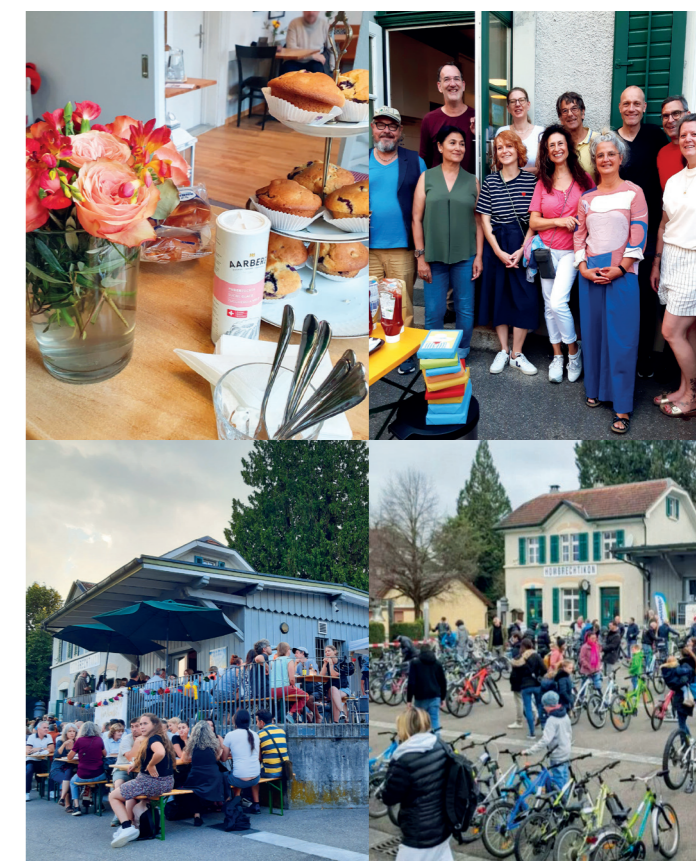
Impressionen Bahnhofli & Happy Friday